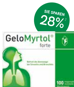
GeloMyrtol® forte Kapseln - 100 Stück