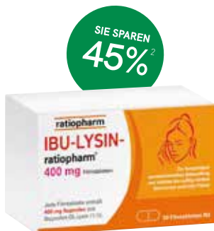
IBU-LYSIN-ratiopharm® 400mg Filmtabletten - 50 Stück