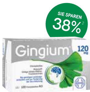
Gingium® 120 mg Filmtabletten - 120 Stück